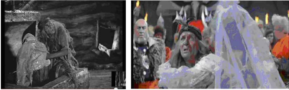
Entremetteuse d'antan, Baba Yaga sera obligée de reprendre la fiancée au lieu d'en procurer une dans Par feu et par flammes (1968).