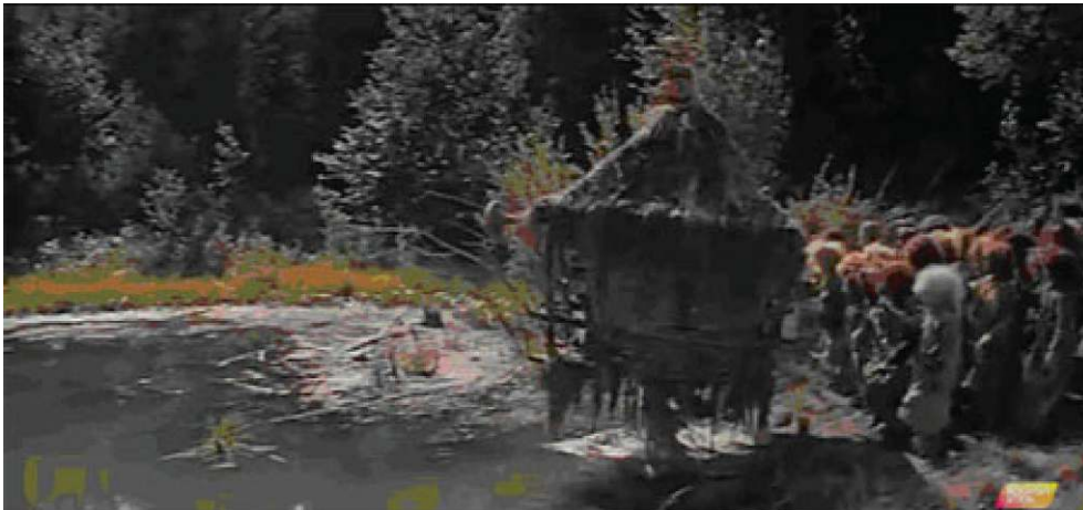
Les enfants-lechii chassent Baba Yaga, cloîtrée dans son isba, dans le marais à la fin de Cornes d'or (1972).