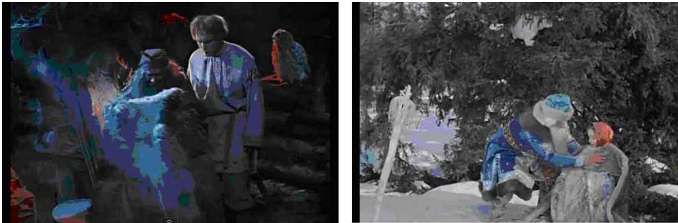
Baba Yaga et Morozko habillent les protagonistes en vêtements chauds.