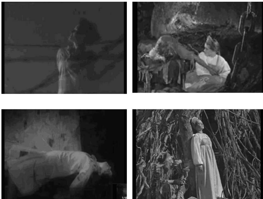
Vues par derrière des chaînes, du fil barbelé ou dans la position de victime sacrificielle, Zoïa Kosmodemianskaïa (à gauche) et Vassilissa (à droite) deviennent des modèles de résistance.

demande officielle d'art inspiré par narodnost' [l'esprit populaire] », un art qui « permettait à la communauté soviétique entière de rester en contact avec l'esprit populaire en tant que source métaphysique de la force communautaire 14 ». L'internationalisme des premières années de l'URSS cédait devant cette vision romantique et profondément essentialiste de la nation.